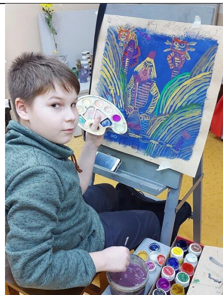
4.Автор за работой