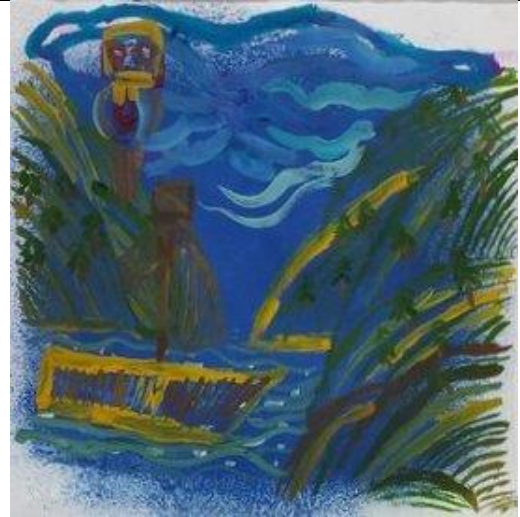
2.Проба техники и манеры художника