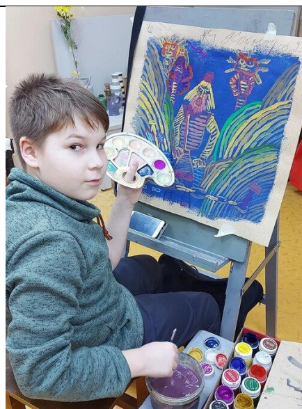
4.Автор за работой