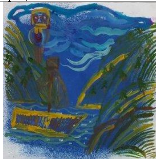
2.Проба техники и манеры художника